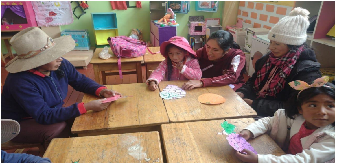
Madres recibiendo la explicación de sus hijas de tareas que realizaron