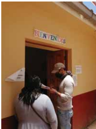
Fotografía 4: Encuestando a pobladora en salón comunal.