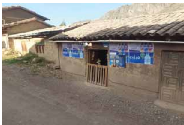
Fotografía 11: Actividades económicas.