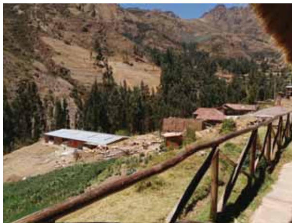
Fotografía 1: Viviendas de la comunidad.