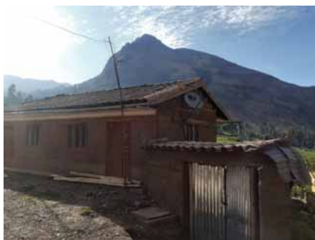
Fotografía 12: Servicio de cable satelital.