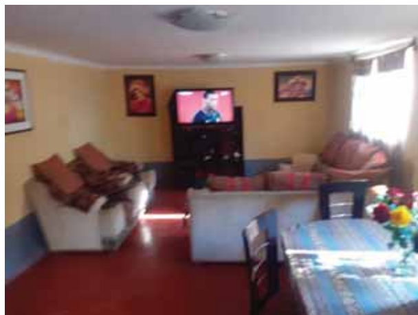
Fotografía 20: Interior de vivienda hospedaje.