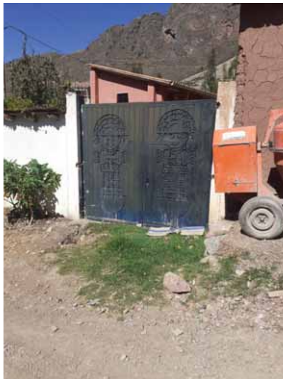
Fotografía 22: Vivienda mejorada.