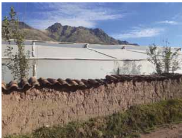
Fotografía 14: Fito toldos.