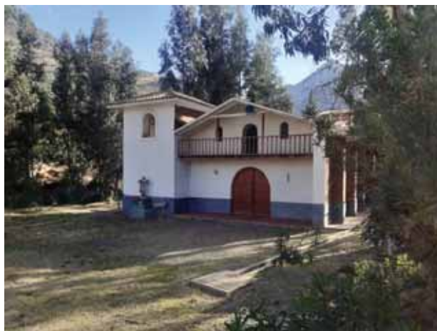
Fotografía 17: Iglesia católica de la comunidad.