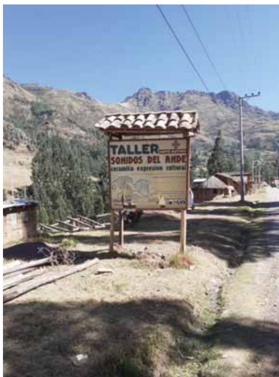
Fotografía 23: Talleres de artesanía – cerámicos.