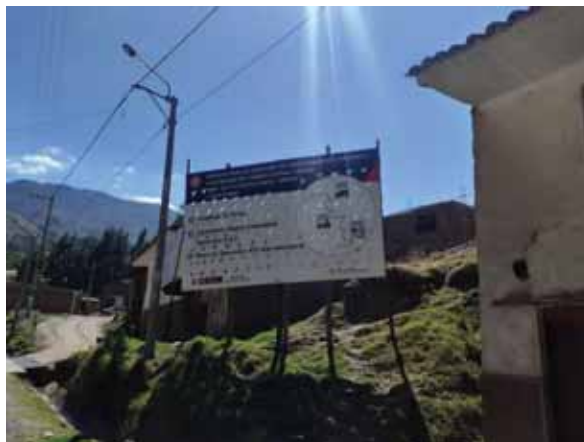
Fotografía 24: Ejecución de obras públicas.