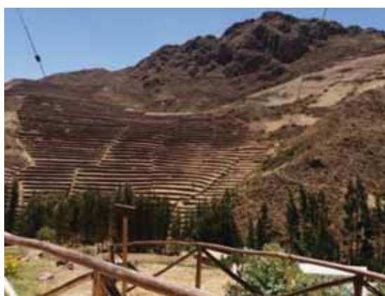
Fotografía 3: Zona arqueológica de Pisac, frente a la comunidad campesina de Cuyo Chico.