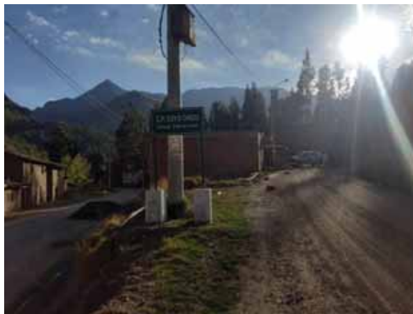
Fotografía 7: Centro poblado de Cuyo Chico.