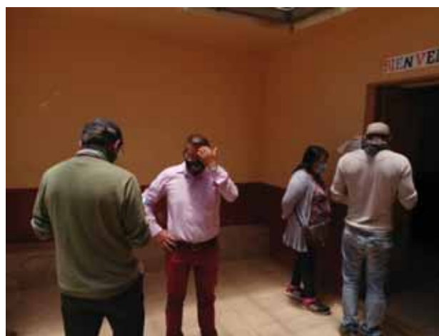
Fotografía 5: Encuestadores.