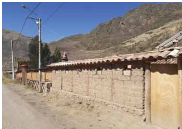
Fotografía 19: Fachadas de hospedaje.