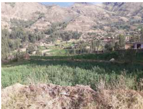
Fotografía 15: Producción agrícola.