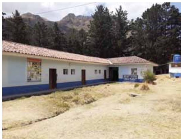
Fotografía 6: Posta de Salud de Cuyo Chico.