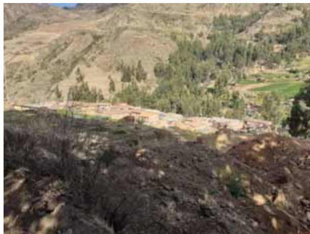
Fotografía 16: Imagen alta de la comunidad