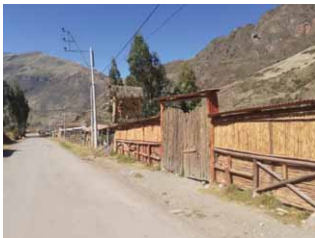
Fotografía 21: Fachada de hospedaje.