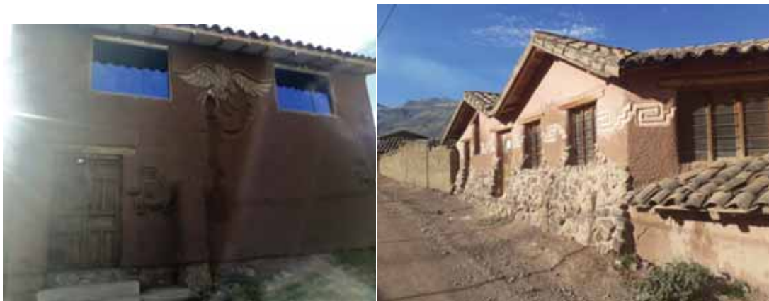
Fotografía 9: Fachadas mejoradas de las viviendas.