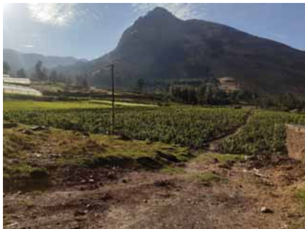
Fotografía 13: Producción agrícola.