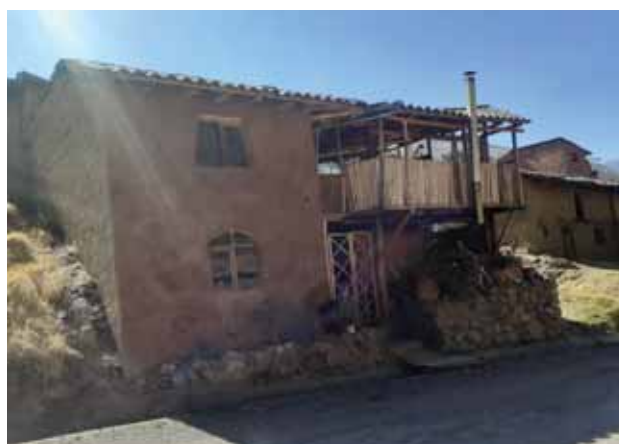
Fotografía 18: Fachada de hospedaje.