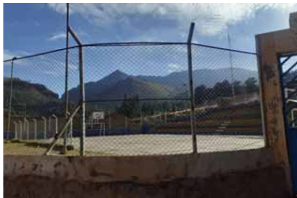
Fotografía 10: Loza deportiva.