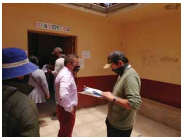
Fotografía 2: Encuestando a poblador.