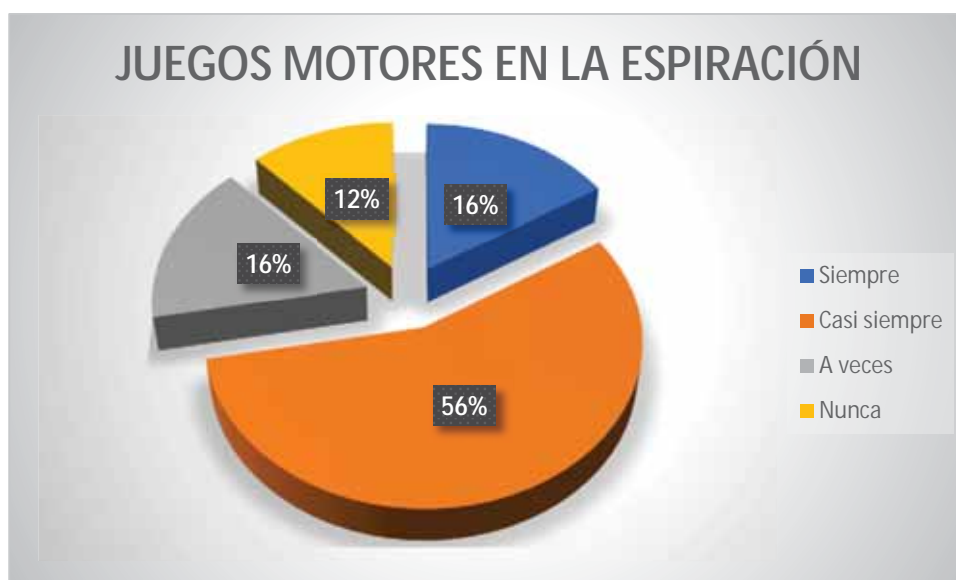
Gráfico 7 Juegos motores en la espiración

Con respecto a los juegos motores en la espiración; 56% de los niños casi siempre ejecuta la espiración aplicando los juegos motores; un 16% a veces ejecuta la espiración aplicando los juegos motores; 12% de los estudiantes ejecuta la espiración aplicando los juegos motores; y un 16% de los alumnos siempre ejecuta la espiración aplicando los juegos motores.