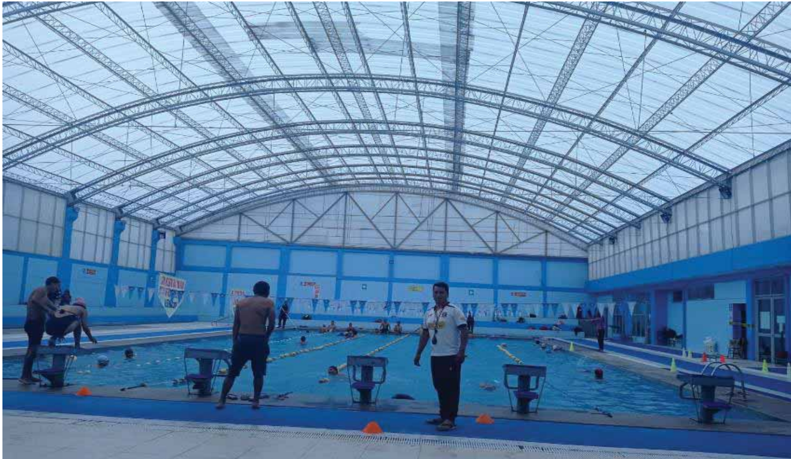
DOCENTE APLICANDO INSTRUMENTO DE INVESTIGACIÓN EN LA PISCINA DEL COLEGIO INCA GARCILASO DE LA VEGA DONDE SE DESARROLLA LAS SESIONES DE CLASE DE LOS QUINTO AÑOS DE SECUNDARIA DE LA I.E. FORTUNATO L. HERRERA