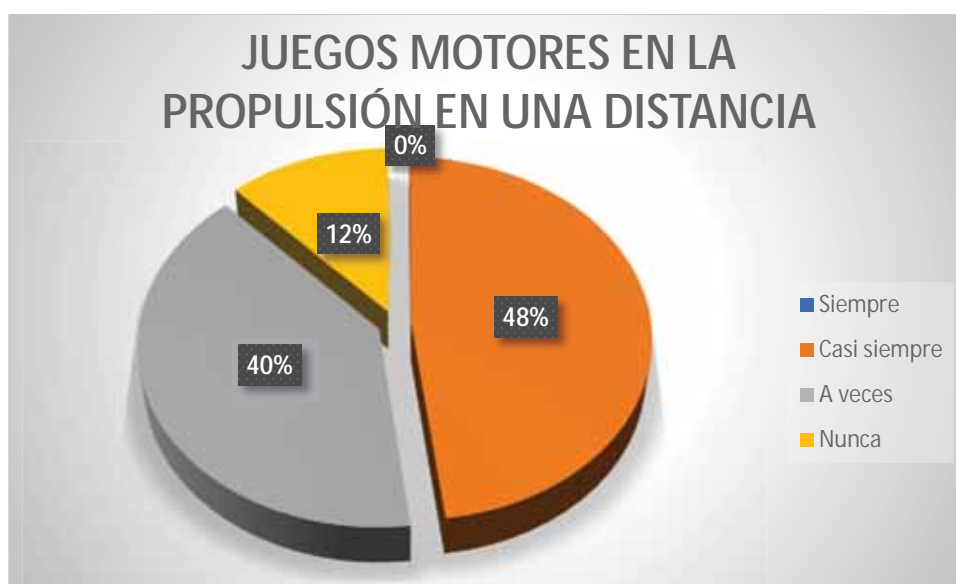
Gráfico 15 Juegos motores en la propulsión en una distancia

Para realizar la propulsión en una distancia determinada en la natación, un 48% de los estudiantes casi siempre hace uso de los juegos motores; un 40% de los estudiantes a veces hace uso de los juegos motores; un 12% de los estudiantes nunca hace uso de los juegos motores.