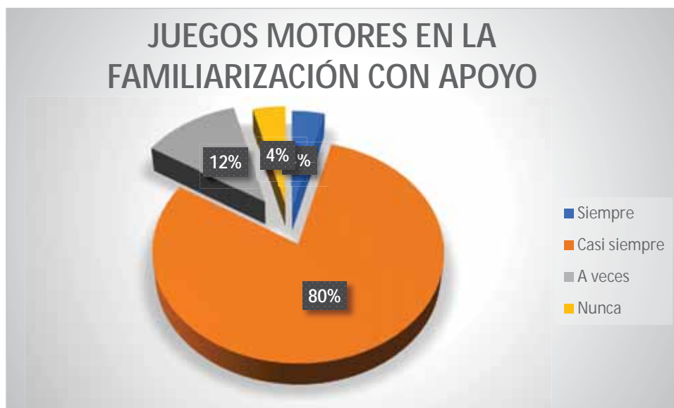
Gráfico 2 Juegos motores en la familiarización con apoyo

Al observar la sesión de clases de los estudiantes se pudo verificar que el 80% de los educandos casi siempre ejecutan la familiarización con apoyo, haciendo uso de los juegos motores; también se verificó que el 12% de los estudiantes a veces ejecutan la familiarización con apoyo, haciendo uso de los juegos motores; un estudiante que representa el 4% nunca ejecuta la familiarización con apoyo, haciendo uso de los juegos motores.