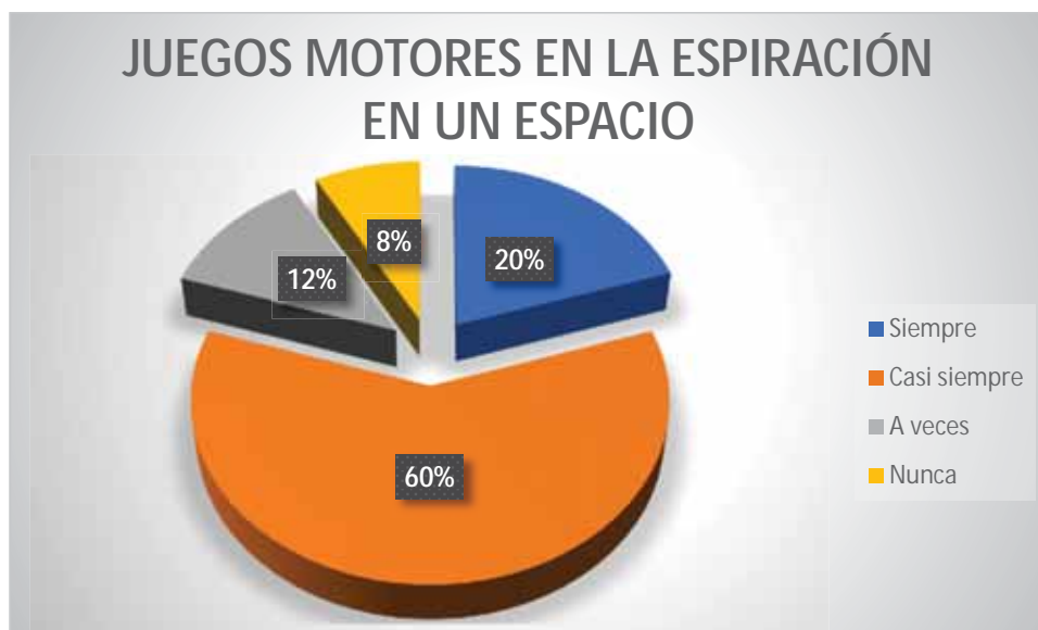
Gráfico 9 Juegos motores en la espiración en un espacio

El 60% de los estudiantes casi siempre ejecuta la espiración en la natación aplicando los juegos motores en el espacio elegido; 12% de los participantes a veces ejecuta la espiración en la natación aplicando los juegos motores en el espacio elegido; 8% de los estudiantes nunca ejecuta la espiración en la natación aplicando los juegos motores en el espacio elegido; resaltamos que un 20% de los estudiantes ejecuta la espiración en la natación aplicando los juegos motores en el espacio elegido.