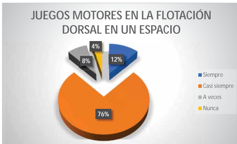
Gráfico 13 Juegos motores en la flotación dorsal en un espacio

En la natación el 76% de estudiantes casi siempre utilizan los juegos motores para ejecutar la flotación dorsal en un espacio determinado; el 8% de estudiantes a veces utilizan los juegos motores para ejecutar la flotación dorsal en un espacio determinado; 4% de los participantes nunca utilizan los juegos motores para ejecutar la flotación dorsal en un espacio determinado; el 12% de los estudiantes siempre utilizan los juegos motores para ejecutar la flotación dorsal en un espacio determinado.