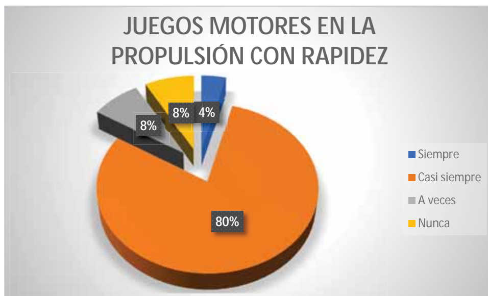
Gráfico 14 Juegos motores en la propulsión con rapidez

El 80% de los estudiantes del quinto grado casi siempre aplican los juegos motores al realizar la propulsión con rapidez; el 8% a veces aplican los juegos motores al realizar la propulsión con rapidez; otro 8% nunca aplican los juegos motores al realizar la propulsión con rapidez; Y un 4% de ellos siempre aplican los juegos motores al realizar la propulsión con rapidez.