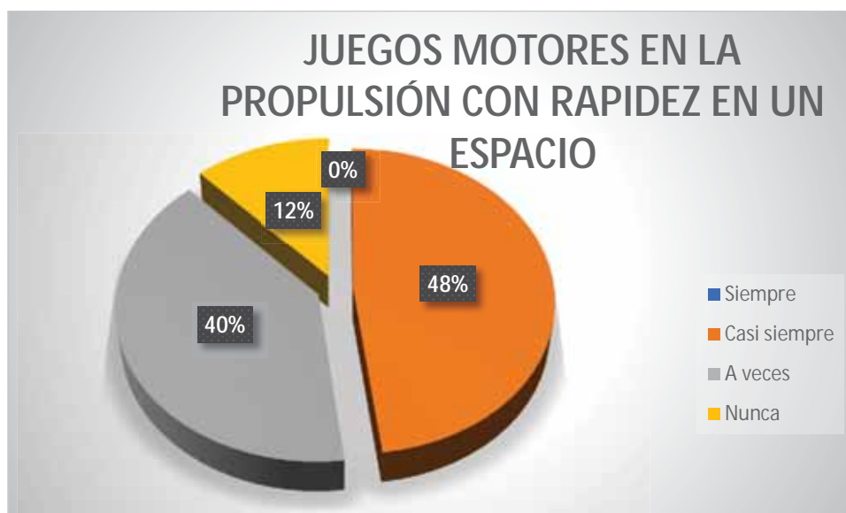
Gráfico 16 Juegos motores en la propulsión con rapidez en un espacio

Aplican los juegos motores para ejecutar la propulsión con rapidez en un espacio asignado, casi siempre un 48% de estudiantes; a veces un 40% de estudiantes; nunca un 12% de estudiantes.