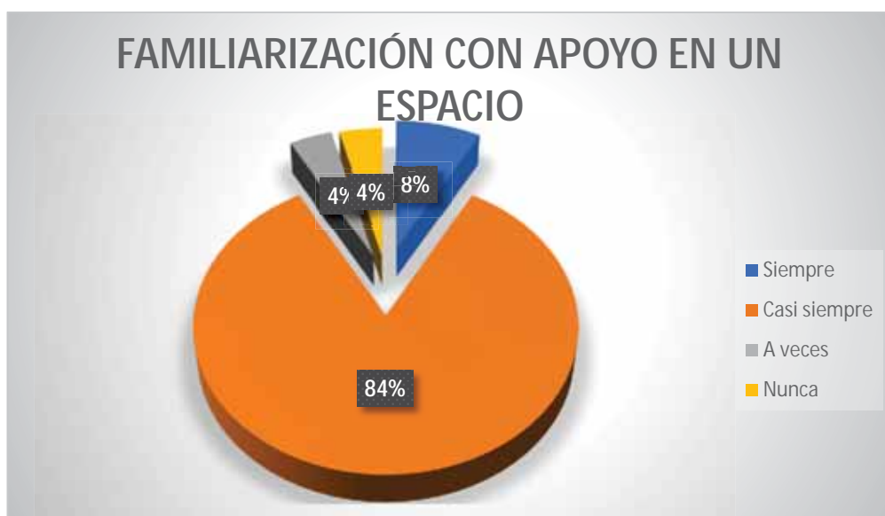
Gráfico 4 Familiarización con apoyo en un espacio

En cuanto a la realización de la familiarización con apoyo en un espacio pertinente, se evidencia que un 84% casi siempre lo ejecuta mediante los juegos motores; un 4% a veces lo ejecuta mediante los juegos motores; también otro 4% nunca lo ejecuta mediante los juegos motores; 2 estudiantes que representan el 8% siempre lo ejecutan mediante los juegos motores.