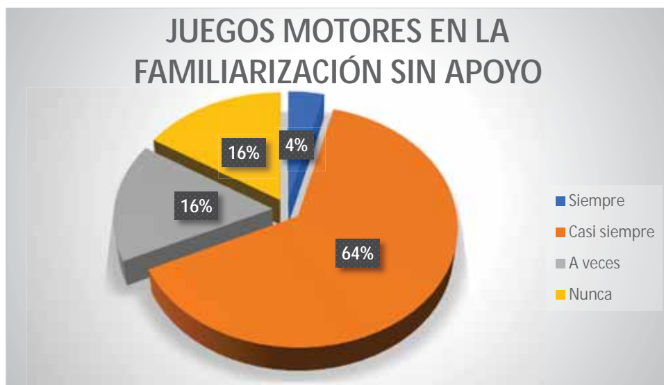
Gráfico 3 Juegos motores en la familiarización sin apoyo

De las sesiones observadas se puede describir que el 64% de los estudiantes casi siempre efectúan la familiarización sin apoyo, aplicando los juegos motores; el 16% a veces efectúan la familiarización sin apoyo, aplicando los juegos motores; igualmente un 16% nunca efectúan la familiarización sin apoyo, aplicando los juegos motores; un estudiante que representa el 4% siempre efectúa la familiarización sin apoyo, aplicando los juegos motores.