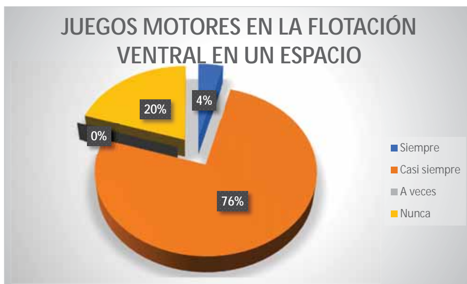
Gráfico 12 Juegos motores en la flotación ventral en un espacio

Los estudiantes en un 76% casi siempre ejecuta la flotación ventral en un espacio señalado aplicando los juegos motores; en un 20% nunca ejecuta la flotación ventral en un espacio señalado aplicando los juegos motores, y en un 4% siempre ejecuta la flotación ventral en un espacio señalado aplicando los juegos motores.