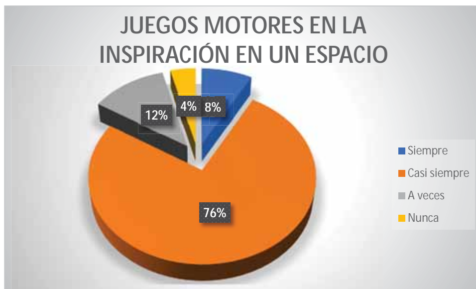
Gráfico 8 Juegos motores en la inspiración en un espacio

Un 76% de los estudiantes casi siempre realiza la inspiración en la natación en el espacio asignado con la ayuda de los juegos motores; un 12% del estudiantado a veces realiza la inspiración en la natación en el espacio asignado con la ayuda de los juegos motores; 8% de los estudiantes realiza la inspiración en la natación en el espacio asignado con la ayuda de los juegos motores; finalmente el 4% realiza la inspiración en la natación en el espacio asignado con la ayuda de los juegos motores.