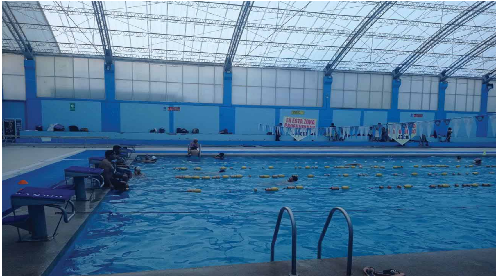
PISCINA DEL COLEGIO INCA GARCILASO DE LA VEGA DONDE SE DESARROLLA LAS SESIONES DE CLASE DE LOS ESTUDIANTES DEL QUINTO AÑOS DE SECUNDARIA DE LA I.E. FORTUNATO L. HERRERA