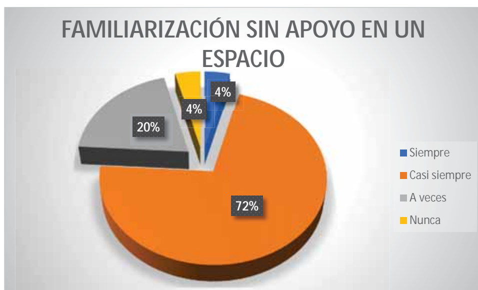
Gráfico 5 Familiarización sin apoyo en un espacio

A la interrogante que se detalla más arriba, se puede responder de la siguiente manera: El 72% de los estudiantes casi siempre efectúa la familiarización sin apoyo en un espacio pertinente aplicando los juegos motores; el 20% a veces efectúa la familiarización sin apoyo en un espacio pertinente aplicando los juegos motores; un 4% de los estudiantes efectúa la familiarización sin apoyo en un espacio pertinente aplicando los juegos motores; el 4% nunca efectúa la familiarización sin apoyo en un espacio pertinente aplicando los juegos motores.