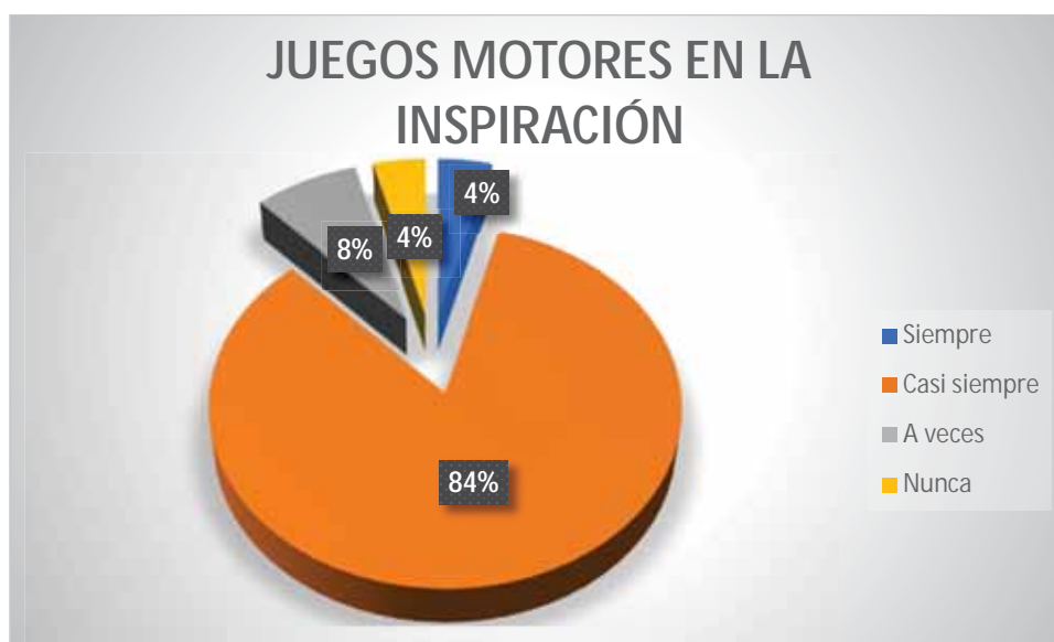
Gráfico 6 El estudiante realiza la inspiración utilizando los juegos motores

Un 84% del estudiantado del quinto grado de primaria, realiza la inspiración en la natación utilizando los juegos motores; 8% de estudiantes a veces realiza la inspiración en la natación utilizando los juegos motores; los estudiantes en un 4% siempre realiza la inspiración en la natación utilizando los juegos motores; y al igual que la anterior 4% de los participantes realiza la inspiración en la natación utilizando los juegos motores.