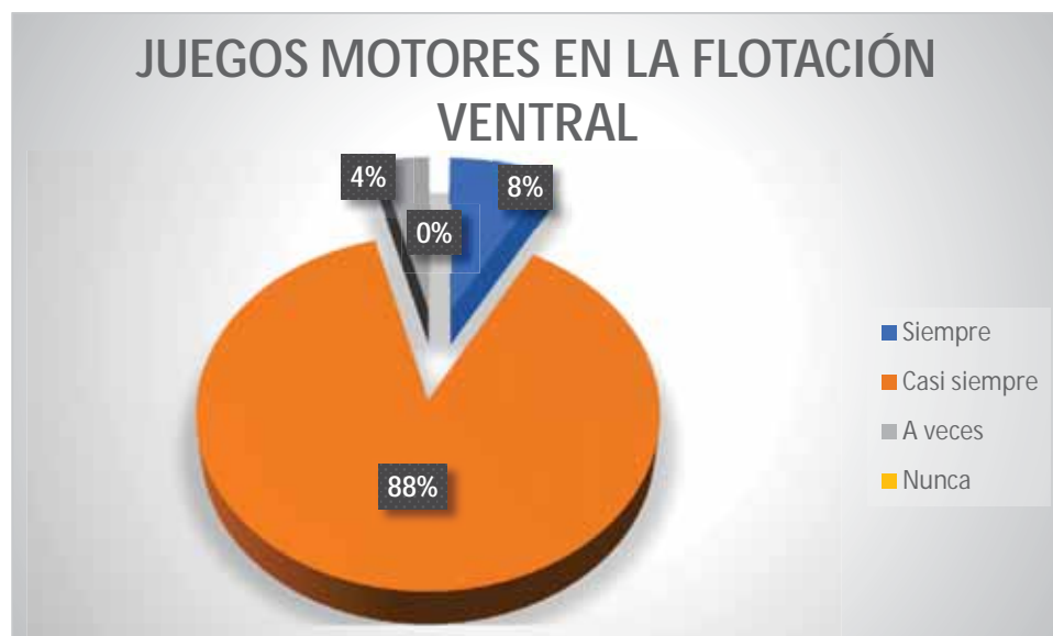
Gráfico 10 Juegos motores en la flotación ventral

En la realización de la flotación ventral aplicando los juegos motores tenemos los siguientes resultados: 88% de los estudiantes lo realiza casi siempre; 4% de los participantes a veces lo realiza; 8% de los niños siempre lo realiza.