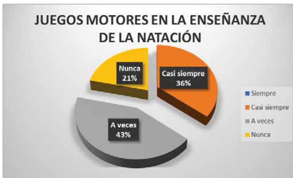
Gráfico 1 Juegos motores en la enseñanza de la natación

En la tabla 3, se observa que del total de las interrogantes efectuadas al docente se tiene como resultado, que el 43% de las interrogantes muestran que a veces los juegos motores inciden en la enseñanza de la natación; por otro lado, un 36% de las interrogantes demuestran que casi siempre los juegos motores tienen efecto en la enseñanza de la natación; y finalmente de las interrogantes respondidas un 21% reflejan que los juegos motores nunca inciden en la enseñanza de la natación.