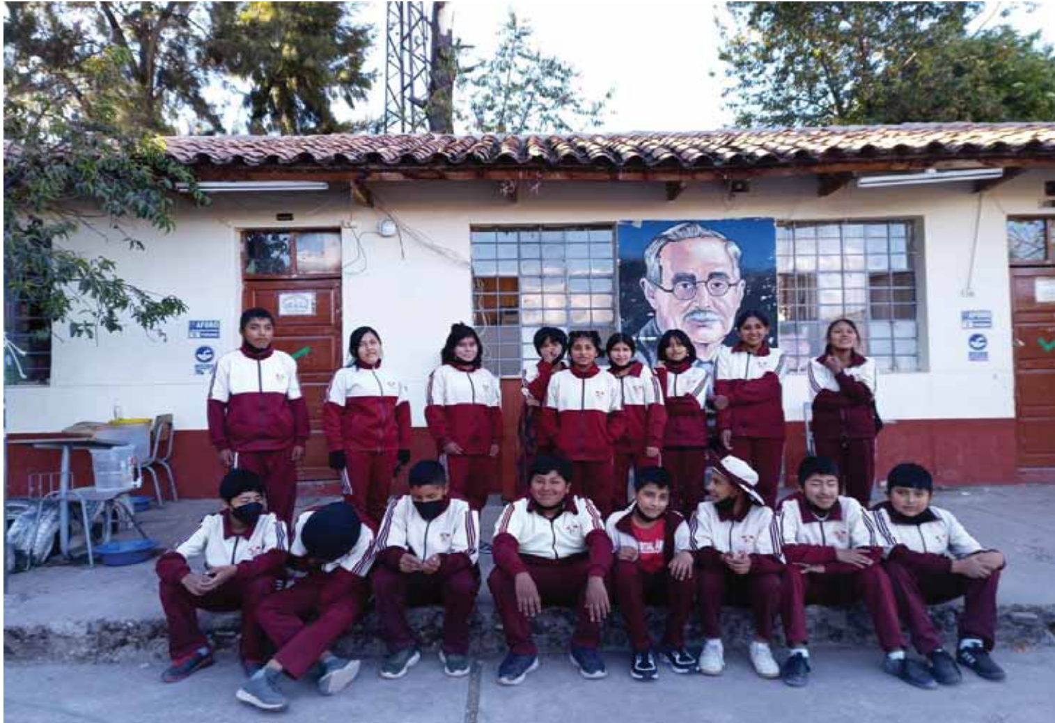
ESTUDIANTES DEL QUINTO AÑO DE SECUNDARIA DE LA I.E. FORTUNATO L. HERRERA 2019