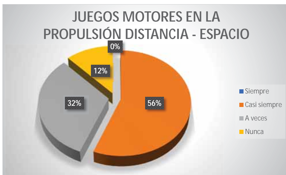
Gráfico 17 Juegos motores en la propulsión distancia - espacio

El 56% de los estudiantes casi siempre hace uso de los juegos motores cuando realiza la propulsión en una distancia y espacio seleccionado en la natación; el 32% de los estudiantes a veces hace uso de los juegos motores cuando realiza la propulsión en una distancia y espacio seleccionado en la natación; el 12% de los estudiantes nunca hace uso de los juegos motores cuando realiza la propulsión en una distancia y espacio seleccionado en la natación.