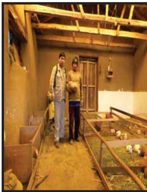
Foto 13 y 14. Ejemplar de reproductor hembra; visita a galpones y entrevista a productores de cuyes