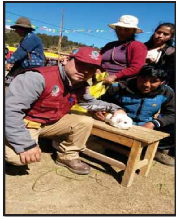
Foto 05 y 06. participación en ferias comunales en juzgamiento de cuyes