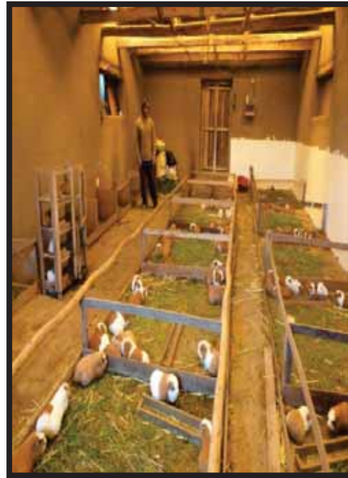
Foto 07 y 08. Participación en ferias agropecuarias comunales; visita a galpón de cuyes