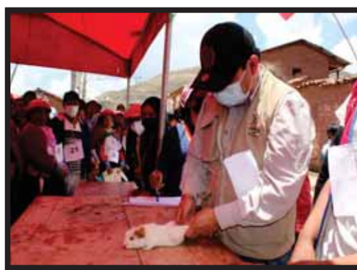
Foto 15 y 16. Participación en juzgamiento de cuyes en comunidades.