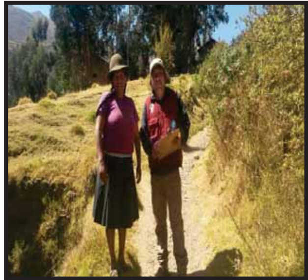
Foto 01 y 02. Encuesta realizada a productores de cuyes