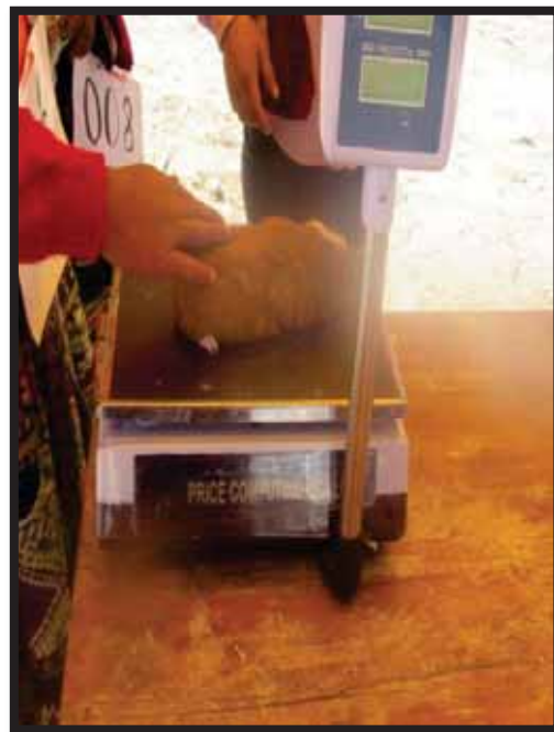
Foto 11 y 12, visita y entrevista con productor de cuyes, pesado de cuyes.