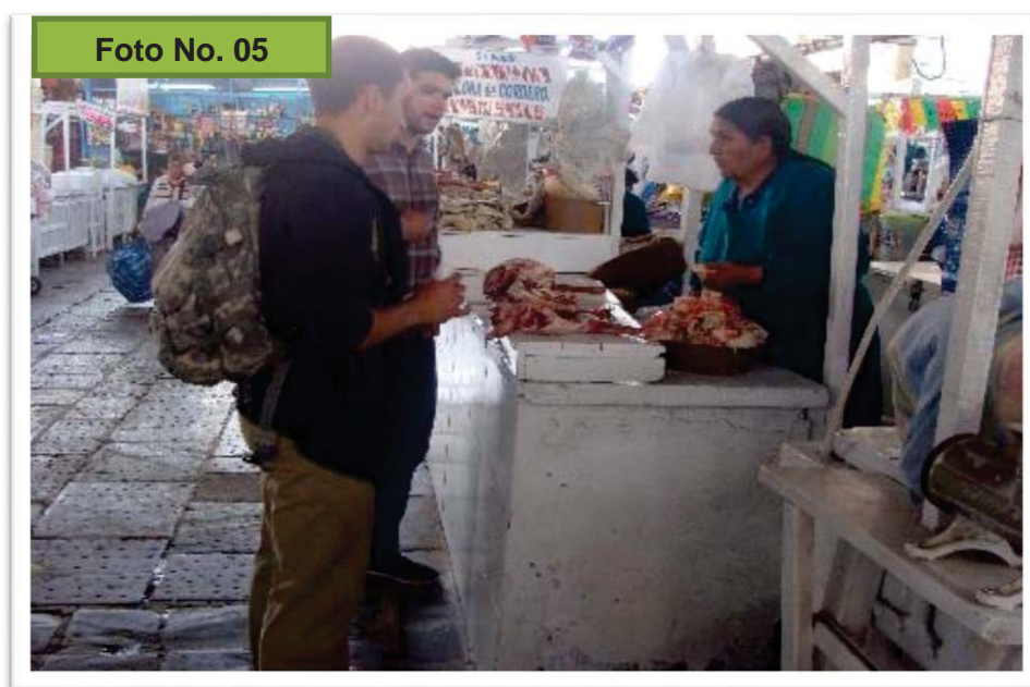
Turistas cotizando el precio de la carne en el mercado de San Pedro 23

La interacción es netamente comercial, muchas veces los turistas solamente van a ver los productos del mercado como algo atractivo, otros realizan sus compras, para ello cotizan los precios en varios lugares, porque algunos van al mercado por buscar costos baratos, en otros casos, como en los puestos de artesanía, los turistas no distinguen la calidad del producto con lo que venden afuera en las tiendas. Pero también las mismas vendedoras se encargan de ofertar sus productos. Las vendedoras consideran que hay diferentes tipos de turistas, algunos no piden descuentos sobre todo los norteamericanos, pero, otros, como el caso de chilenos o argentinos cotizan precios muy baratos, e incluso en otros casos, hay extranjeros que roban, o tratan de engañar a las vendedoras.