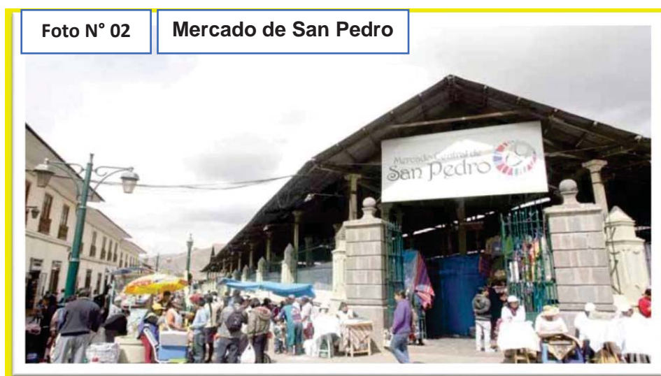
La puerta principal del Mercado San Pedro, que da hacia la Calle Santa Clara 18 .

La infraestructura del mercado ha sido superada por la condición de ser principal dentro de la estructura de la ciudad, sin considerarse el explosivo crecimiento urbano y su necesidad de desconcentración. La influencia del mercado se manifiesta en todo el ámbito inmediato, debido a la aparición de comercios relacionados con los de abastos, deviniendo en el sector comercial más dinámico de la ciudad. En las calles aledañas se observa tiendas de ropas, telas, bazares, zapaterías y otros, que por su fuerte demanda han generado actividades propias tornadas en tradicionales. El crecimiento de la vocación comercial de este sector ha propiciado la aparición del comercio informal cada vez más descontrolado que ha invadido y apoderado del espacio público.