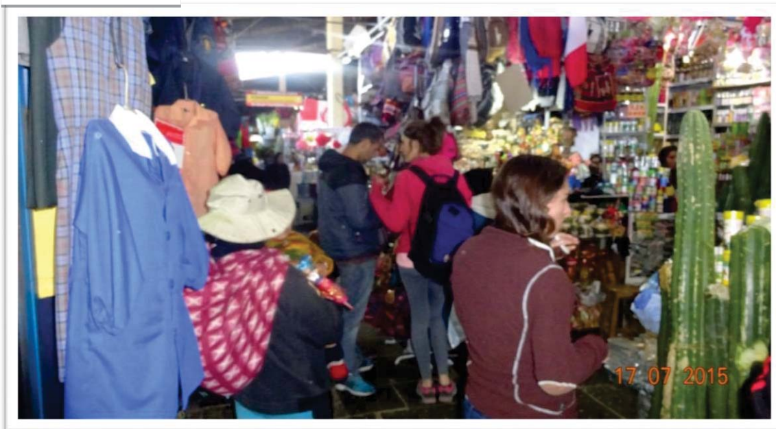
Cambio de rubro e incremento de puestos de venta de objetos de curanderismo andino por la presencia de turistas nacionales y extranjeros 26 .