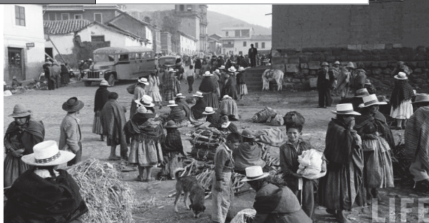
Antiguo Mercado de San Pedro

Fuente: https://www.google.com.pe/foto-antigua -del Mercado de San Pedro, después del terremoto de 1950.