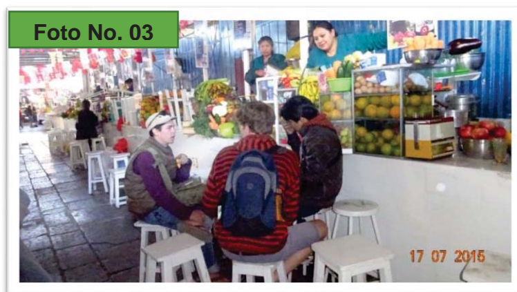
Un grupo turistas tomando jugo en el mercado de San Pedro 19

La erradicación del comercio ambulatorio y proyectos impulsados por la Municipalidad de Cusco con apoyo de la Agencia Española de Cooperación Internacional para el Desarrollo, así como por el Centro Guamán Poma de Ayala fueron el comienzo de una nueva etapa para San Pedro. Los comerciantes asentados alrededor del mercado de Qhasqaparo y calles aledañas fueron reubicados en diferentes centros comerciales. Se remodeló la Calle Tupaq Amaru, convirtiéndola en un amplio paseo peatonal para los vecinos y visitantes. La construcción de la Plazoleta de San Pedro ha permitido a la ciudad ganar un espacio para las ferias de artesanía, salud, gastronomía y otras, para destacar la calidad arquitectónica del Templo de San Pedro.