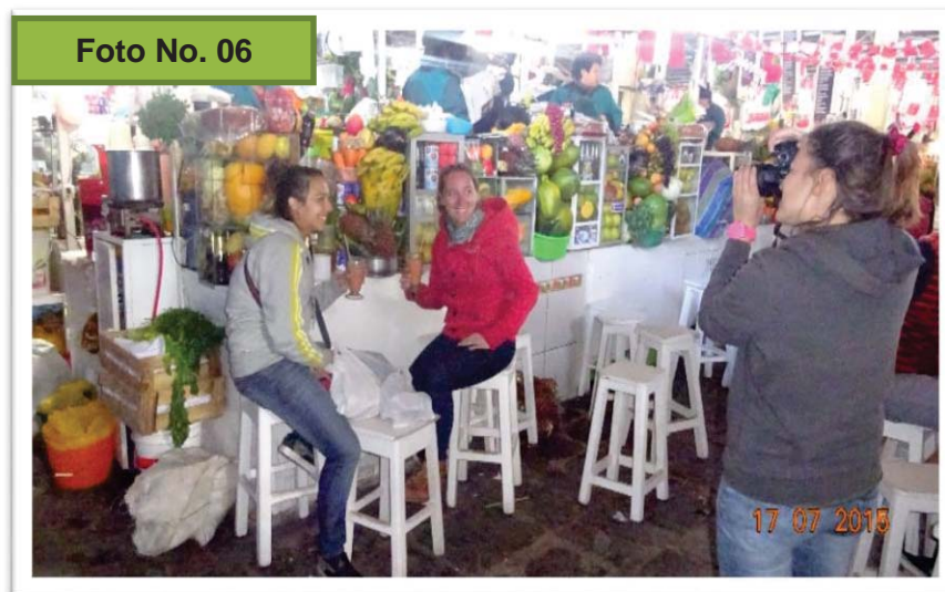
Turistas tomándose fotos en la sección de jugos 24